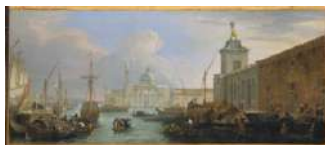
Le Bassin, venise, vue de la douane avec au loin l'île de San Giorgio – 1709 Luca Carlevarijs – italien – 1663-1730 The Metropolitan Museum of Art, New York, USA – Non visible actuellement