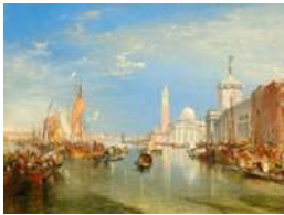
Venise : la douane et San Giorgio Maggiore – 1834 Joseph Mallord William Turner – anglais – 1775-1851 national Gallery of Art, Washington, USA – Galerie 57