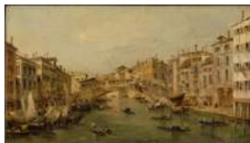
Rialto – XVIIIe siècle Inconnu – atelier de Francesco Guardi The Metropolitan Museum of Art, New York, USA – Galerie 541