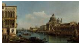
Vue du Grand Canal: Santa Maria della Salute et la Douane depuis le Campo Santa Maria Zobenigo – 1743 Bernardo Bellotto – italien – 1722-1780 J. Paul Getty Museum, Los Angeles, USA – Non visible actuellement