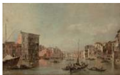
Le Grand Canal à Venise vue du Palais Bembo – vers 1768 Francesco Guardi – italien – 1712-1793 J. Paul Getty Museum, Los Angeles, USA – Galerie S201