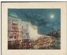
Le grand canal pendant le carnaval, Venise – vers 1860/1880 unknown – italian J. Paul Getty Museum, Los Angeles, USA – Non visible actuellement