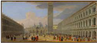
Place Saint Marc, Venise – 1709 Luca Carlevarijs – Italie – 1663-1730 The Metropolitan Museum of Art, New York, USA – Non visible actuellement