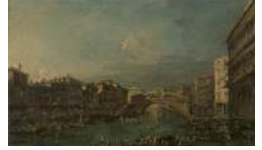
Régate sur le grand canal Francesco Guardi – italien – 1780-1793 Rijks Museum, Amsterdam, Hollande