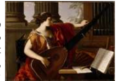
Allégorie de la Musique – 1649 Laurent de la Hyre – français – 1606-1656 The Metropolitan Museum of Art, New York, USA – Non visible actuellement