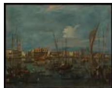
Venise depuis le bassin de Saint Marc – 1765-75 Francesco Guardi – italien – 1712-1793 The Metropolitan Museum of Art, New York, USA – Non visible actuellement