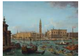
Procession de gondoles sur le bassin de Saint Marc, Venise – 1742 Antonio Joli – italien – 1700-1777 National Gallery of Art, Washington, USA – Non visible actuellement