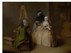
The Painter in His Studio – 1741/1744 Pietro Longhi – italien – 1701-1785 J. Paul Getty Museum, Los Angeles, USA – Non visible actuellement