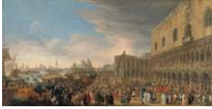
Entrée de l'ambassadeur français dans Venise – 1706/1708 Luca Carlevarijs – italien – 1663-1730 Rijks Museum, Amsterdam, Hollande – salle 1.4